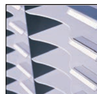
Porte-étiquettes et étiquettes fournis