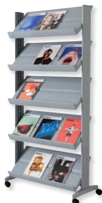
255N.35 teinte alu