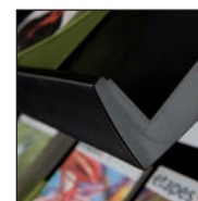
Rebord de tablette : 4 cm