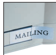
Livré avec porte-étiquettes et étiquettes