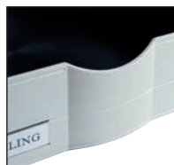
Forme ergonomique pour faciliter la préhension