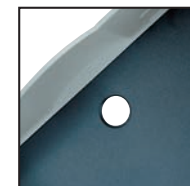
Perforation de la base du tiroir pour faciliter la préhension