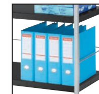
Galerie chromée pour le maintien des classeurs