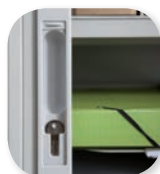
serrure encastrée avec cache de finition