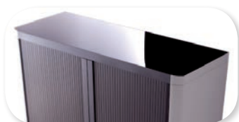
dessus de finition laqué