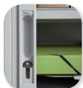
serrure encastrée avec cache de finition