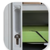
serrure encastrée avec cache de finition