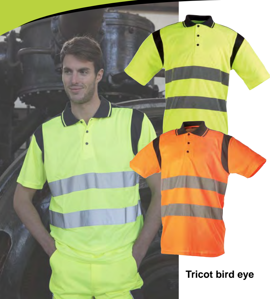
Tricot bird eye