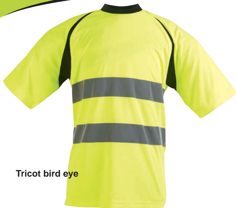
Tricot bird eye